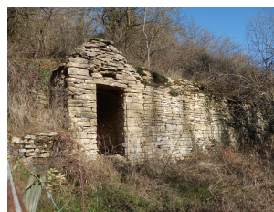
Les cadoles de la Peinière

La voie du tacot, ancienne ligne de chemin de fer qui reliait en 2 heures 20 minutes Villefranche à Tarare pour 34 km. La salle des fêtes, baptisée Salle du Tacot, occupe le lieu de la gare. Ce chemin de Fer du Beaujolais a fonctionné de 1902 à 1934. Il transportait indifféremment habitants, marchandises, bétail. Aujourd'hui le tracé, long de 24 km, va de Liergues (commune des Pierres Dorées) à Sarcey ; il traverse 8 communes, leurs vignobles, leurs bois, leurs prairies, il est accessible aux marcheurs, aux vététistes, aux poussettes ... selon l'état du revêtement.